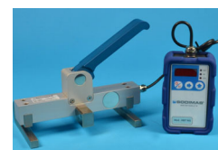
Tensiomètre MBT-1500 14 010 104EN